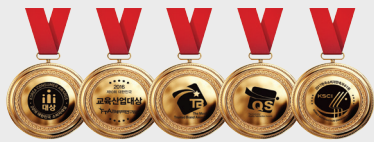
소비자만족 및 교육산업대상 수상

똑같은 시간을 투자하고서도 결과가 다른 이유!! 이유는 “ 최적화된 학습법 ”에 있습니다.