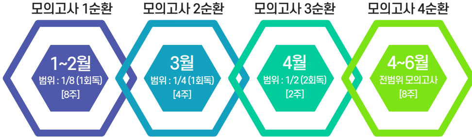
2차 모의고사반 운영과정